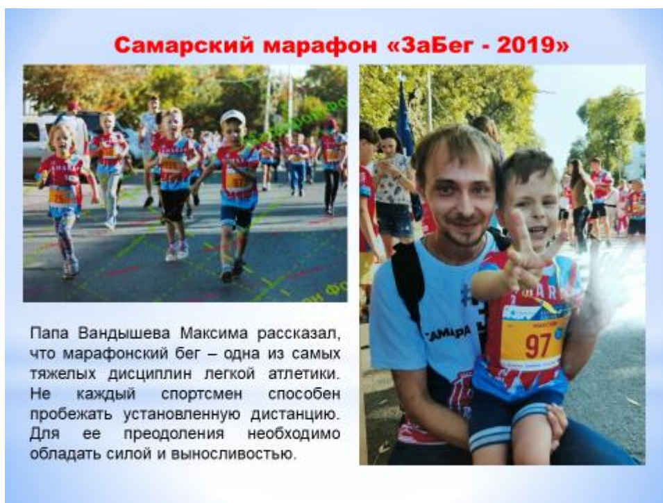
Фото 3. Воспитанник группы принял участие в забеге вместе с папой