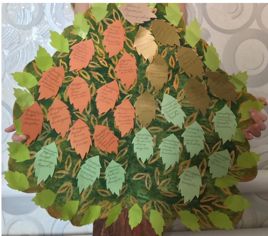
Фото 2. Рис. Генеалогическое дерево семьи воспитанницы подготовительной к школе группы Варвары И.